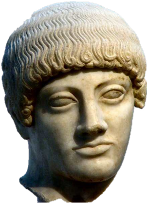
Blonde Youth , c. 485 B.C. Acropolis Museum, Athens, Greece.

There is a singularity event in the world's history of statuary art, which due to Being's mode of triple concealment has eluded Dasein's attention. This discovery precipitates in the history of art from the appearance of the Euthydikos Kore next to yet another surviving Greek statue, the Blonde Youth . These two statues have been chronologized some five years apart in Dasein's volatile datability, although the unnerving phenomenon of the absolute duplicity of these two faces has been paradigmatically, nonetheless superficially justified, by the renowned art historian Sir John Boardman as being the work of the same artist: «The head [of the Blond Youth ] has much in common with that of Euthydikos Kore , which is somewhat earlier, and could be by the same artist whom some have thought Peloponnesian by training. 33 »