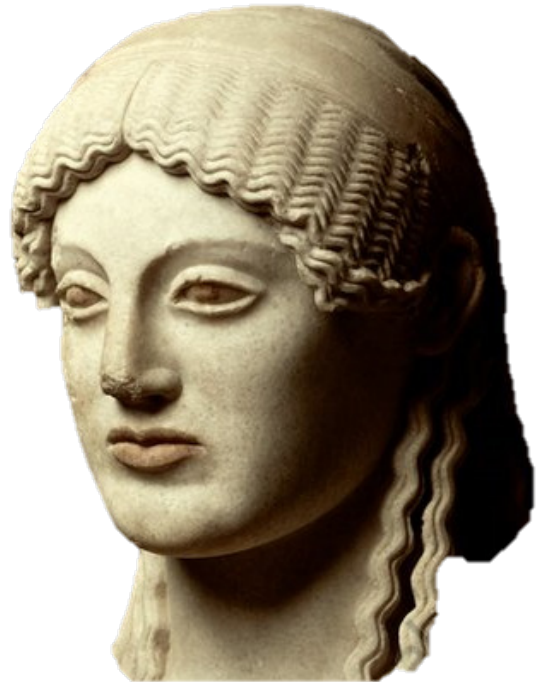
Euthydikos Kore , c. 490 BC Acropolis Museum, Athens, Greece.

specifically, and the face of one Greek statue in particular, becomes relevant. The Euthydikos Kore , an odd hitherto seen as «female» Greek statue that lingers in between the Archaic realm of mythos and the Classical realm of logos, of circa 490 B.C., becomes most relevant once we consider that Being as a world-disclosive attunement is originary Angst, that is, a mood , and that arguably the original manifestation of moods into the world that they determine can only appear as human face. This art may be our only chance for an interpretation that would not be biased, because its only prejudice would precede any interpretation in its recognizing and conforming to the prejudice that determines the possibility of perception as interpretation in the first place.